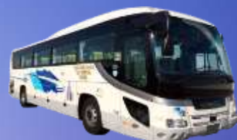
バス会社:中日臨海バス