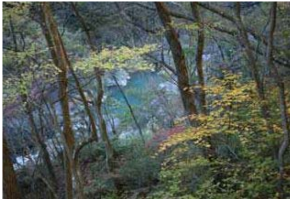
アップダウンの坂道はあせらず ゆっくりと歩きましょう 奇岩が織りなす青い渓谷の絶景

さらに10分ぐらい歩くと白岩半島の分岐点に到着します。白岩展望台に向かって右側の坂道を登っていけば白岩バス停があります。湯西川温泉発鬼怒川温泉行きの東武ダイヤルバスが運行しています。