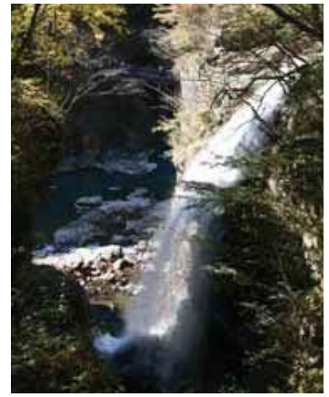
晴れた日に美しい虹がかかる虹見の滝

東武鬼怒川公園駅より徒歩5分 TEL: 0288-76-2683 営業時間: 10:00~21:00 (入浴受付は20:30まで) 定休日: 毎週火曜日 (祝祭日にあたるときは翌日) 入浴料: 大人 (中学生以上) 510円 小人 (小学生) 250円