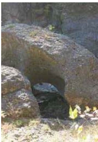
自然の神秘 白い溪谷のかめ穴

川の右側に続くややアップダウンのある山道を歩くと、眼下に白っぽい流紋岩により形成されている溪谷の眺めを満喫することができます。とくに、虹見の滝から約20分のところで見る「かめ穴」は、いちばんの見所です。かめ穴はまだ川底だった頃、穴になつている部分の岩質が、流されてきた石より柔らかかったため、渦巻きの流れの中で石が臼のような働きをして造られたものです。