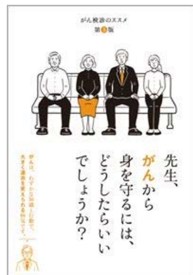
「がん検診のススメ」(小冊子)

当組合では、がん予防に関する取組や、健診を受けた方への補助金の支給制度を設けております。がんの知識と対策がまとめられた小冊子や健康啓発のリーフレット等も多数ご用意しております。資料請求も可能ですので、詳しくは当組合事務局までお問い合わせください。